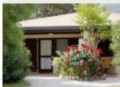
Einraum Bungalow A

Für ein bis drei Personen bieten die ebenerdigen Bungalows in Reihenbauweise Platz. Diese sind je nach Größe mit einem Bett, zwei Betten oder zwei Betten und einem Zustellbett ausgestattet. Die Bungalows verfügen über eine solide Ausstattung, das Bad ist mit einer Dusche und einem WC versehen, die Terrasse mit Gartenmöbeln.